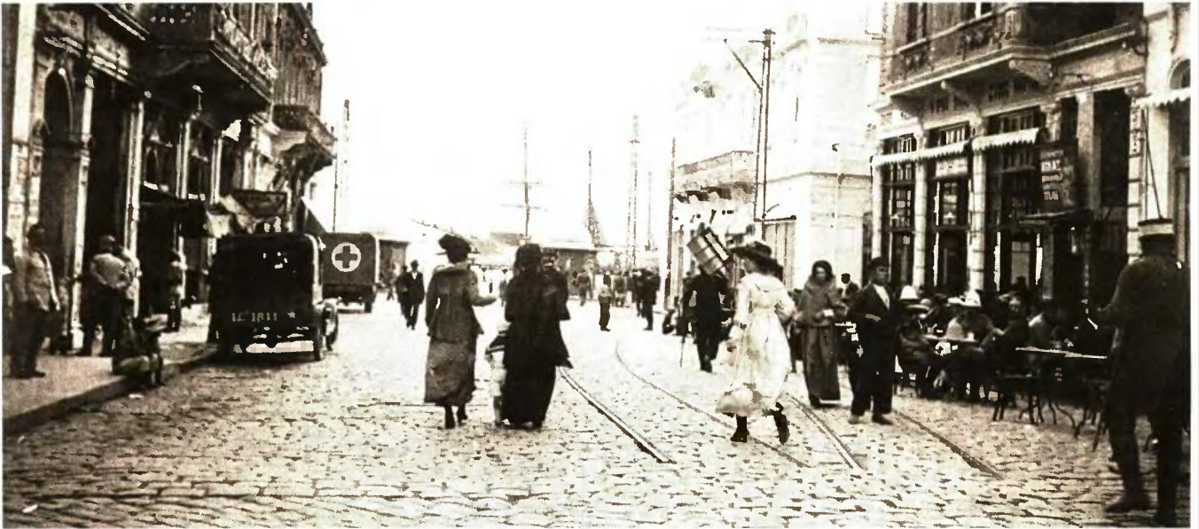
Αποψη της οδού Βενιζέλου