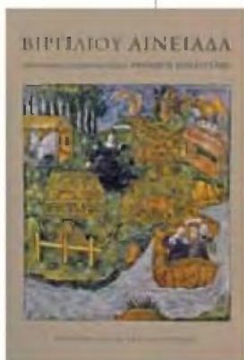
ΒΙΡΓΙΛΙΟΥ ΑΙΝΕΙΑΔΑ, μτφ. Θεόδωρος Παπαγγελής, εκδ. Μορφωτικό Ίδρυμα Εθνικής Τραπέζης

Βέβαια ως τώρα δεν μίλησα για την εκπληκτική μετάφραση της «Αινειάδας» από τον Θεόδωρο Παπαγγελή. Δεν μίλησα επειδή ότι και να πω θα είναι λίγο. Οφείλουμε όλοι να τη διαβάσουμε και να γαλβανίσουμε έτσι το όργανο της γλώσσας μας στο μεταφραστικό του αλχημείο. Κύριε Παπαγγέλη, σας ευχαριστώ και ως Έλληνας και σαν Τρώας. ●