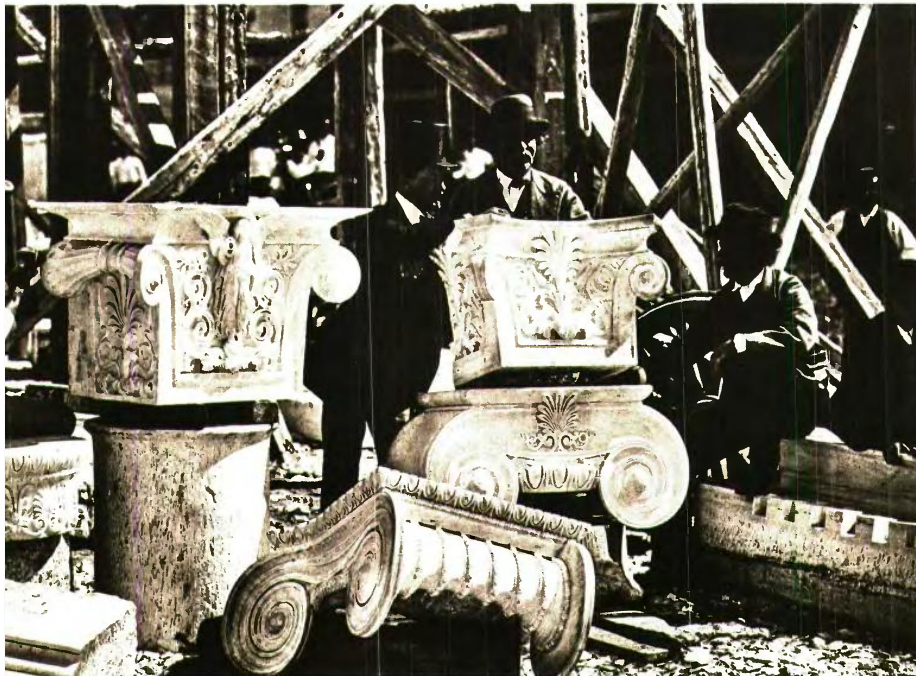
ΑΚΑΔΗΜΙΑ ΚΑΘΩΝ ΤΕΚΝΩΝ, ΚΑΤΑ ΟΡΙΑ ΧΑΝΣΕΝ, ΒΙΕΝΝΗ (ΑΠΟ ΤΟΝ ΤΟΜΟ ΤΗΣ «ΑΛΗΘΟΓΡΑΦΙΑΣ»)