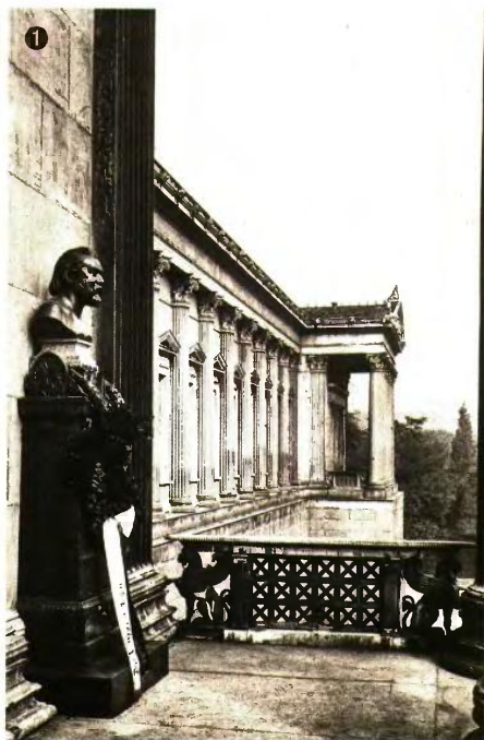
ΑΚΑΔΗΜΙΑ ΚΑΛΩΝ ΤΕΧΝΩΝ ΚΑΤΑΛΟΓΙΑ ΧΑΝΣΕΝ, ΒΕΝΝΗ (ΑΠΟ ΤΟΝ ΤΟΜΟ ΤΗΣ «ΑΛΛΗΛΟΓΡΑΦΙΑΣ»)

Ο αναγνώστης εντυπωσιάζεται από τις λεπτομερείς, ακριβείς περιγραφές, που δημιουργούν τόσο ζωντανές εικόνες σχεδόν σαν να τις παρακολουθεί στην τηλεόραση σε ζωντανή μετάδοση. Αναγγέλλοντας την