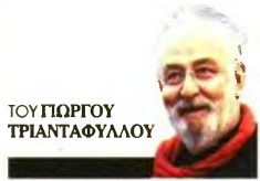
ΤΟΥ ΓΙΩΡΓΟΥ ΤΡΙΑΝΤΑΦΥΛΛΟΥ

Bernard Tschumi, Δ. Φιλιππίδης, Π. Τσακόπουλος, Α. Κυριτσόπουλος / Δ. Αντωνακάκης, Ε. Βερναρδάκη, Τ. Μπίρης, Μ. Κορρές, Β. Γρηγοριάδης / Έκδοση Μοντέρνα Αρχιτεκτονική, Α. Κούρκουλας και Μ. Κοκκίνου, Κ. Δασκαλάκη / Κ. Γρέγου, Σ. Τσιάρα, Δ. Τρίκας, Χ. Μαρίνος / Penny Siopis, Ν. Παπαδόπουλος, Β. Καραμπατσάκη, Βάλβη Νομίδου