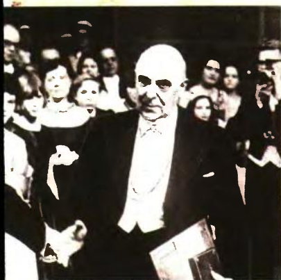
ο Σεφέρης κέρδισε το Νόμπελ Λογοτεχνίας το 1963