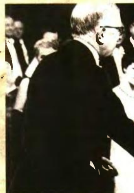
Μεταξύ 80 συγγραφέων και λογοτεχνών