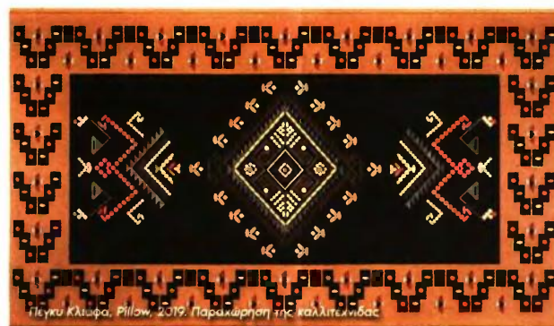
Πέγκυ Κλιψά, Pillow, 2019. Παραχώρηση της καλλιτεχνίδας

Εθνική Βιβλιοθήκη της Ελλάδος, 3 Οκτωβρίου 2019 έως τα μέσα Ιανουαρίου 2020