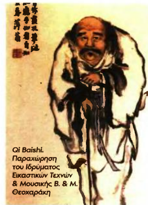
Qi Baishi.