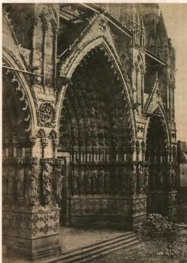
Ο καθεδρικός ναός της Nôtre Dame στην Αμιένη, το 1852.

Πρόκειται για το κείμενο μιας διάλεξης που εκφώνησε ο Πανόφσκυ στο Saint Vincent College της Pennsylvania το 1948. Η δημοσίευση της μελέτης αυτής το 1951 είχε μεγάλη απήχηση, όπως δείχνουν οι πολυάριθμες βιβλιοκρισίες, επα-