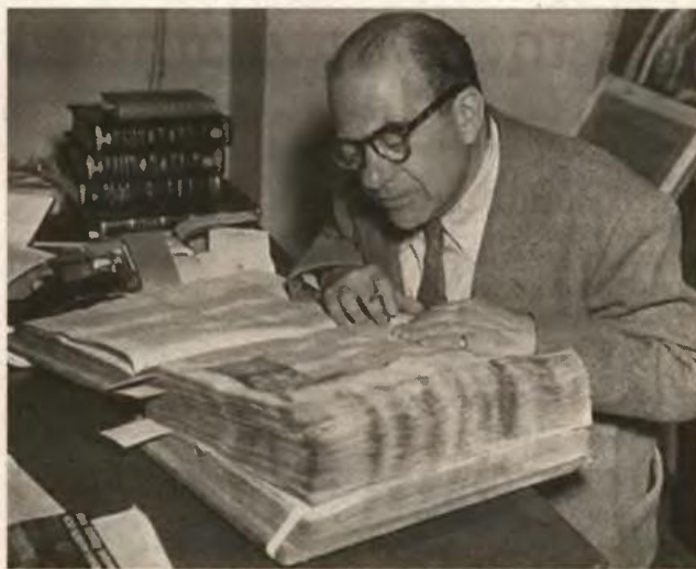
Aegleio Jewitsh. Voice from Germany

Ο τρόπος λειτουργίας των σχολαστικών φιλοσόφων βασίζεται σε έναν τρόπο ύπαρξης ( modus essendi ), ο οποίος προκύπτει από το καθοριστικό για το σχολαστικισμό αίτημα της εξήγησης ή διασάφησης (την αρχή του manifestare ): την ανάγκη δηλα-