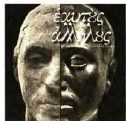
Ο κατάλογος της έκθεσης που θα διαρκέσει έως τον Μάρτιο