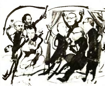
Ένα κολλάζ, μια ιστορική παρέα, έργο του Δημήτρη Μυταρά ανάμεσα στα εκθέματα