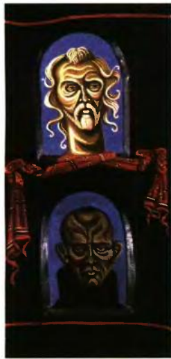
Βασίλης Φωτόπουλος, «Βασίλης και Διονύσης Φωτόπουλος»