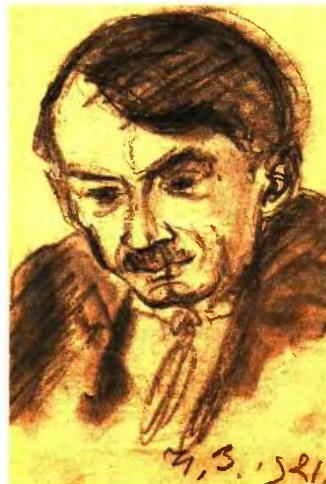
Γιώργος Μπουζιάνης, «Αυτοπροσωπογραφία»