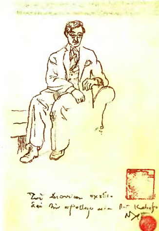
Στη Σίονια οχείο... και με σφραγίδα του Κ.Π. Καβάφη ΝΧ