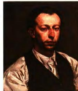
Εκτός από τους καθηγητές του, ζωγράφιζε και τους φίλους και συναδέλφους του. Πορτρέτο του γλύπτη Γιάννη Παππά από τον Μόραλη το 1938