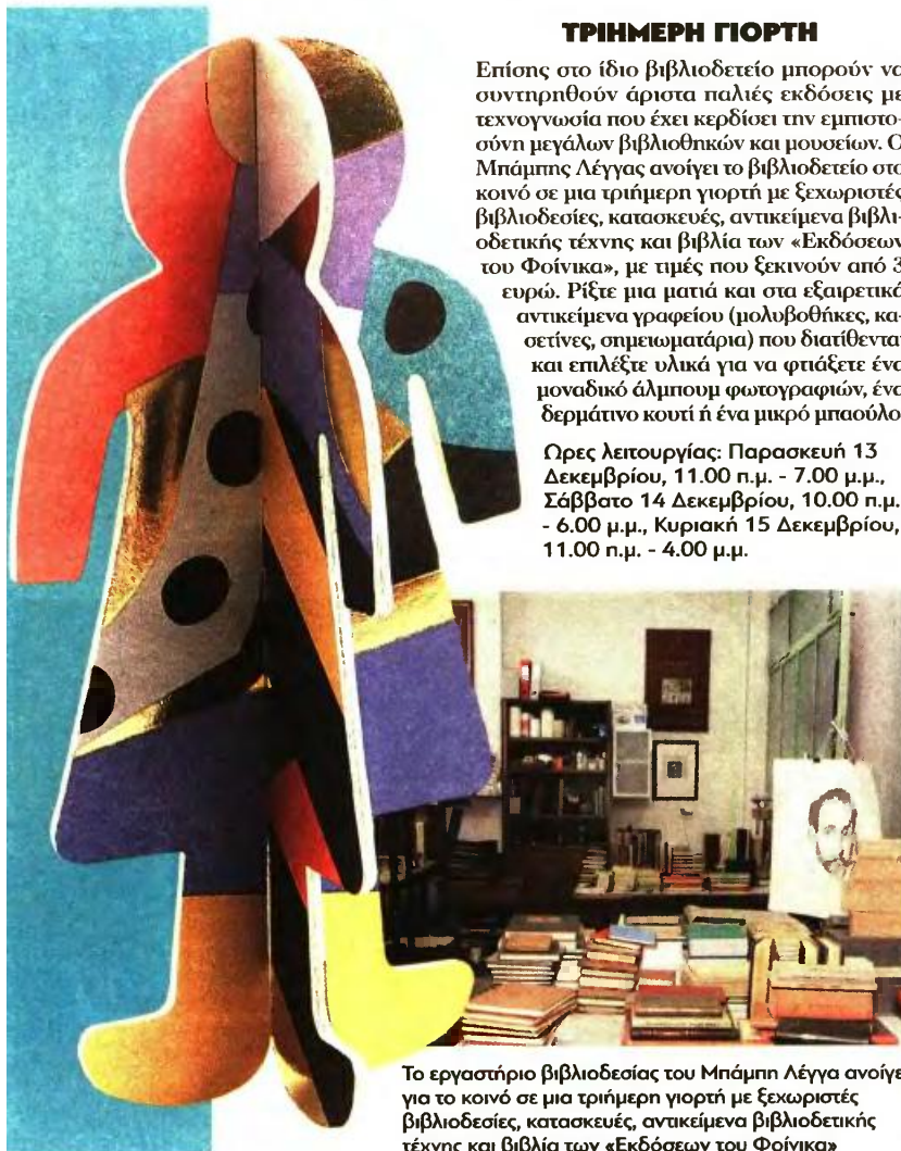
Το εργαστήριο βιβλιοδεσίας του Μπάμπη Λέγγα ανοίγει για το κοινό σε μια τριήμερη γιορτή με ξεχωριστές βιβλιοδεσίες, κατασκευές, αντικείμενα βιβλιοδετικής τέχνης και βιβλία των «Εκδόσεων του Φοίνικα»

Ώρες λειτουργίας: Παρασκευή 13 Δεκεμβρίου, 11.00 π.μ. - 7.00 μ.μ., Σάββατο 14 Δεκεμβρίου, 10.00 π.μ. - 6.00 μ.μ., Κυριακή 15 Δεκεμβρίου, 11.00 π.μ. - 4.00 μ.μ.