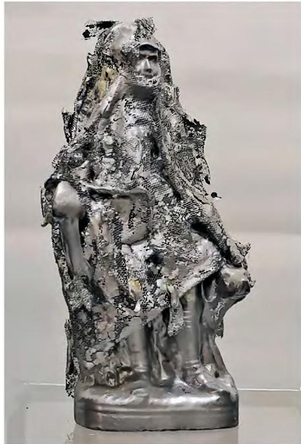
«Κλυτηγός», Χ.Χ., μικτή τεχνική, 27 x 14 x 11 εκ.