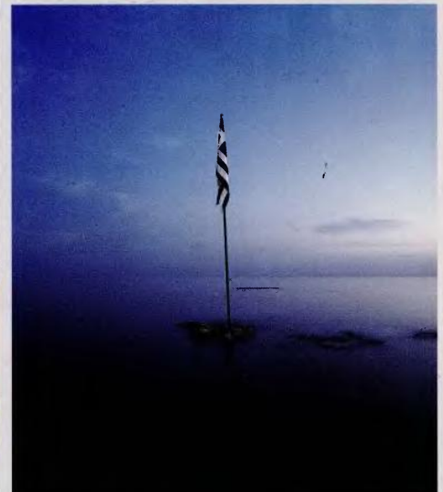
« Απέναντι στο πέλαγος, σε άμεση επαφή με τον αέρα, την αλμύρα, το φως, νιώθει κανείς να βρίσκεται ανάλαφρα, σιωπηλά, πρόσκαιρα κάτι από τον μύκιο εαυτό του» (Ηρακλής Πασιπαιώννου).

Παναγιάς της Φλεβαριώτισσας. Καταχειμώνα. Οι νέες αυτές εικόνες, αν και έχουν το μεγαλείο της θάλασσας, έχουν ταυτόχρονα και κάτι σκοτεινό. Ένα νέο ταξίδι, απαράλλαχτο κι όμως τόσο διαφορετικό. Η καμένη λέμβος και η μοναχική σημαία είναι οι τελευταίες χειρονομίες μιας επικαιρότητας, που θα καθεί κι αυτή στα βάθη του χρόνου.»