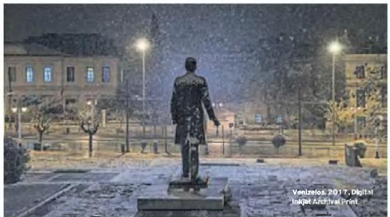
Venizelos, 2017, Digital Inkjet Archival Print