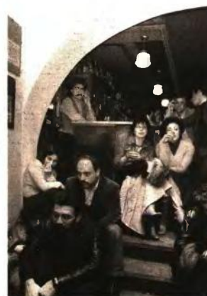
Κατάνυξη και ιλαρότητα στον «Δον Κιχώτη», το «τζαζ-κουτούκι» της εποχής. 1979

«Στην αργοκίνητη βαλκάνια ποστ-χούντα Θεσσαλονίκη βρεθήκαμε αιφνης αντιμέτωποι με διαδικασίες πρωτόφαντες τεινόντας το ους σε ηχοχρώματα πρωτόγνωρα, σε ακολουθίες συγχορδιών ανεπίτρεπτες»