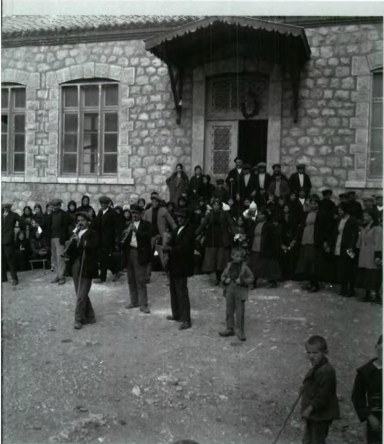
Εκδρομή της Ελληνικής Περιηγητικής Λέσχης στην Οίτη. Χορός στην Παύλιαν Φθιώτιδα, 1932.