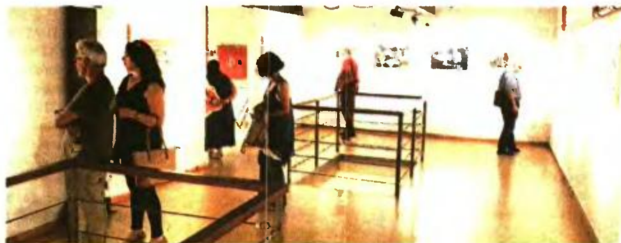
Λάτρεις της φωτογραφίας, φωτογράφοι, αλλά και απλός κόσμος βρέθηκαν χθες στα εγκαίνια της έκθεσης φωτογραφίας «Νέα ερείπια»

πλήνωσης του Αβραάμ Παυλίδη, ο οποίος έχει μια μακρά παράδοση, σχεδόν τριών δεκαετιών, στη φωτογράφιση χώρων της παράδοσης και χώρων που έχουν εγκαταλειφθεί. Μετά από τους ιδιωτικούς χώρους και τα μικρά κλίμακα οικήματα, εργοστάσια, μαγαζιά, αποφάσισε να κάνει ένα βήμα αρκετά μεγαλύτερο σε χώρους μεγαλύτερης κλίμακας, όπως εργοστάσια μαζικής παραγωγής, αλλά και χώρους που είτε χρησιμοποιήθηκαν μαζικά είτε παρήγαγαν μαζικές συμπεριφορές, όπως νοσοκομεία, στρατόπεδα, ψυχιατρεία, σχολεία». Σύμφωνα με τον ίδιο, το αποτέλεσμα είναι ένα υποβλητικό πανόραμα χώρων είτε χάσκουν κατεστραμμένοι είτε έχουν αφήσει γοητευτικά ερείπια. «Γιατί η έρευνα αυτή άρχισε το 2010, που είναι ουσιαστικά η αφετηρία της οικονομικής κρίσης για την Ελλάδα, δεν είναι εύκολο να τη συνδέσουμε άμεσα με το φαινόμενο αυτό, διότι πολλοί από