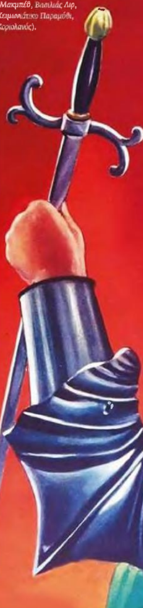
Ο Λόρενς Ολβιε ως Ηγάρδος ο 3ος στην περιφημη ταινία.

πηριστών όπως ο Ουίλιαμ Χάλζιτ, ο Τζορτζ Στάνιερ ή ο Χάρολντ Μπλουμ, οι οποίοι διέκριναν μια εξαιρετική κορυφή στη δραματουργική πορεία του Σαίξπηρ που ξεκινά από τις πρώτες, πιο αμήχανες, συγκριτικόμενες απόπειρες χαρακτηριστικής σκιαγράφησης και φτάνει στην κορύφωση της βαθιάς ψυχολογικής ανάλυσης του τι μπορεί να κρύβεται στην καρδιά και στο μυαλό του πιο δόλιου ηγεμόνα ( Μακμπέθ , Βασιλιάς Λιρ , Χειμωνιάτικο Παραμύθι , Κοριολάνος ).