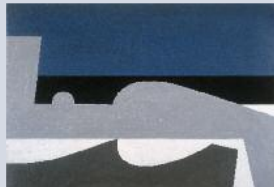
Το νησί , 1976. Ακρυλικό σε μουσαμά, 114 x 165 εκ.

...ο Καβάφης δούλενε πολύ τα ποιήματά του, έγραφε και ξαναέγραφε το ίδιο ποίημα. Κι εμένα μου αρέσει πάρα πολύ αυτή η χειρονομία, να σκίζω και να πετώ τα προσχέδια.