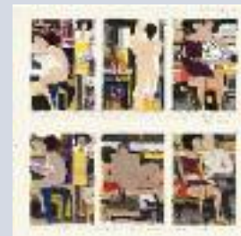
Μελέτες για το τρίπτυχο Επιθαλάμιο , 1968

Ένα από τα θέματα που διατρέχουν ολόκληρο το έργο του Μόραλη από τη δεκαετία του 1960 μέχρι σήμερα είναι ο έρωτας. Οι σκηνές από την προετοιμασία του γάμου στην αρχαία Ελλάδα που έβλεπε στα αγγεία και η θεματολογία των τραγουδιών ενέπνευσαν μια σειρά από έργα τα οποία ονόμασε αργότερα «επιθαλάμια». Στα Επιθαλάμια εξελίσσεται με ένταση η πορεία προς την αφαίρεση και μέσα από αυτή τη διαδικασία ο ζωγράφος προβάλλει το μυστήριο του έρωτα.