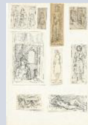
Σύνθεση 9 σχεδίων, 1941-7