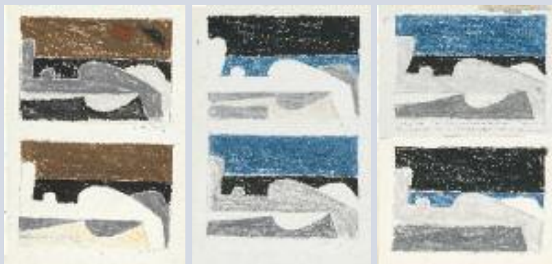
Προσχέδια για Το νησί , 1976