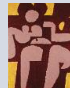
Γυμνό , 1975. Ακρυλικό σε μουσαμά, 81 x 65 εκ.

Διατρέχοντας την τέχνη του από τη δεκαετία του 1970 και μετά συμπεραίνουμε πως μέσα από τα ερωτικά του έργα ο Μόραλης «συνεχίζει να αναπλάθει την ανθρώπινη μορφή και, ενισχύοντας την αρμονία της σύνθεσης και τονίζοντας παράλληλα την αίσθηση της κίνησης και του ρυθμού, δημιουργεί ένα νέο σύστημα μορφών».