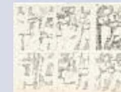
Προσχέδια για το έργο « Γυμνό », 1975.