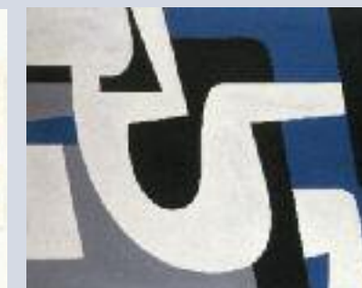
Ερωτικό , 1981. Ακρυλικό σε μουσαμά, 130 x 162 εκ.

Μέσα από αυτή την πορεία οι μορφές χάνουν τα χαρακτηριστικά τους, οι φόρμες και τα σχήματα απλοποιούνται και «το κάθε έργο αποτελεί εξέλιξη και συνέχεια του προηγούμενου» κρατώντας συμπτυκνωμένη την ουσία και την αλήθεια του. Με τη διαδικασία της αφαίρεσης, ο Μόραλης αναδεικνύει το ουσιαστικό και προβάλλει την ιερότητα του έρωτα «οπτικοποιώντας» το μυστήριο της ύπαρξης.