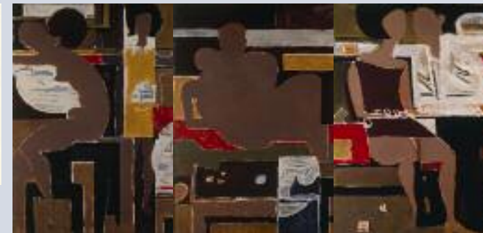
Επιθαλάμιο , 1968, λάδι σε μουσαμά, τρίπτυχο 100 x 250 εκ.