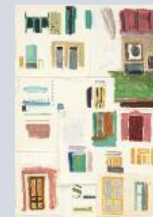
Σημειώσεις, Αίγινα 1950

...δεν ζωγράφιζα επηρεασμένος από την ελληνικότητα... είναι οι μνήμες και τα βιώματα ενός ανθρώπου που έζησε μέσα σε αυτούς τους χώρους, που βγαίνουν υποσυνείδητα και εκφράζονται με σύγχρονο τρόπο.