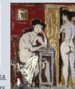
Προσχέδια για τη Σύνθεση Α', 1949-58