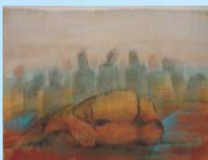
«Σίφνος, Πέτρες-Σώματα», 1990.

Ενδεικτικό της εμπιστοσύνης που είχε στην τέχνη του Μαγκανάρη είναι η ανάθεση του σχεδιασμού των πρωτογραμμάτων που χρησιμοποιήθηκαν στο μυθιστόρημα «Νυχτερίδα» από την τριλογία «Ακυβέρνητες Πολιτείες», ένα από τα σημαντικότερα μυθιστορήματα του 20ού αιώνα.