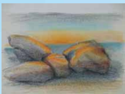
«Δύση στη Σίφνο», 1990.