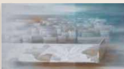
«Ενός λεπτού σιγή», 1978-1980.