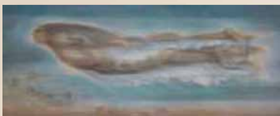
«Η πτήση», 1968.

Το 1947-1948 γνωρίζεται με τον Στρατή Τσίρκα και γίνονται επιστήθιοι φίλοι, με μια συνεχή αλληλοϋποστήριξη σε θέματα τέχνης και πολιτικής. Ο Μαγκανάρης παρομοιάζε την προσωπικότητα του Τσίρκα στον χώρο της γραφής με εκείνη του Πικάσο στο χώρο της ζωγραφικής. Θαύμαζε το γεγονός πως ο φίλος του «ζυμώνει την τέχνη του με μαγιά παρμένη από τη ζωή» και συνάμα υπηρετούσε την τέχνη του γραψίματος για να «κατακτήσει την αλήθεια» και «το πολιτικό του όραμα» για έναν πιο δίκαιο κόσμο. Αντίστοιχα, ο μεγάλος Αλεξανδρινός συγγραφέας αναφερόταν στο «δημιουργικό ήθος του Μαγκανάρη, το λιτό υλικό και τις υψηλές ιδέες του που παραμένουν προσηλωμένες στο πνεύμα και το φυσικό περιβάλλον της Ελλάδας» . Αγαπούσε το ιδιαίτερο ύφος του φίλου του και θεωρούσε πως ο καλλιτέχνης, αφού μελέτησε με προσοχή τα διάφορα ρεύματα ζωγραφικής, δεν ακολούθησε κανένα, προσπαθώντας με «φωτεινή λιτότητα» να ακολουθήσει τον δικό του δρόμο. Ο Τσίρκας πίστευε πως μέσα από αυτόν τον δρόμο δημιούργησε έναν δικό του κώδικα που «μέσα από πέτρες, νερά και σύννεφα... καταγράφεται η πορεία του ανθρώπου πάνω στη γη» , ενώ «η διάσταση του χρόνου ... καταργεί τα περιγράμματα, σβήνει τις λεπτομέρειες και απαλαίνει το χρώμα» .