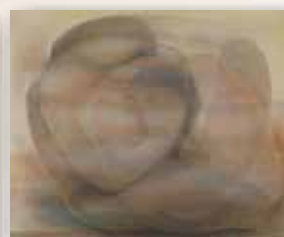
«Στην αγκάλη», 1973.