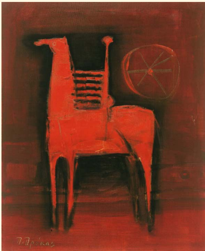
Πάρις Πρέκας, «Κόκκινο ἄλογο με ἀναβάτη», λάδι, 79 x 65 ἐκ.