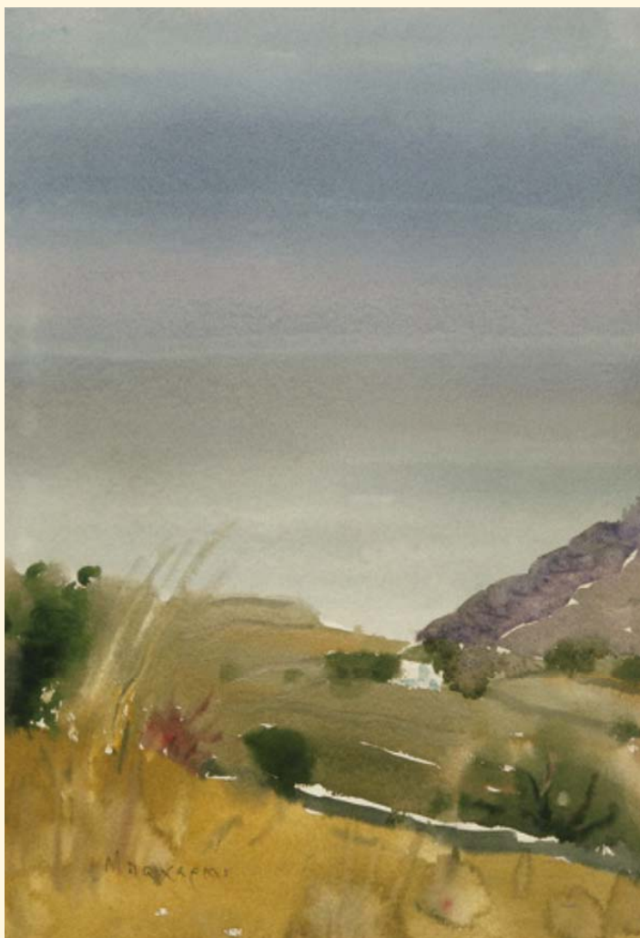
Άσαντούρ Μπαχαριάν, «Τοπίο», 1972, ύδατογραφία, 49 x 34 εκ.