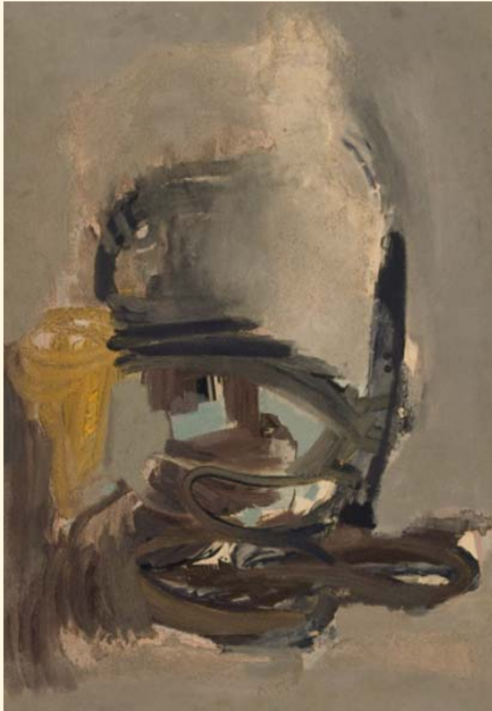
Νίκος Σαχίνης, Χωρίς τίτλο, 1960-'63., λάδι, 100 × 68 εκ.