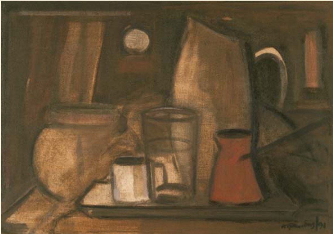
Κώστας Τραχίδης, «Νεκρή φύση-έσωτερικό», 1991, vinamil, 33 × 47 εκ.