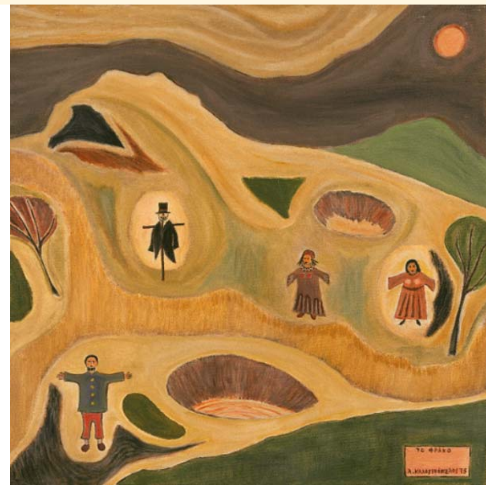
Ἄγγελος Καλογερόπουλος, «Τὸ φράκο», 1975, ἀκρυλικό, 40 x 40 ἐκ.