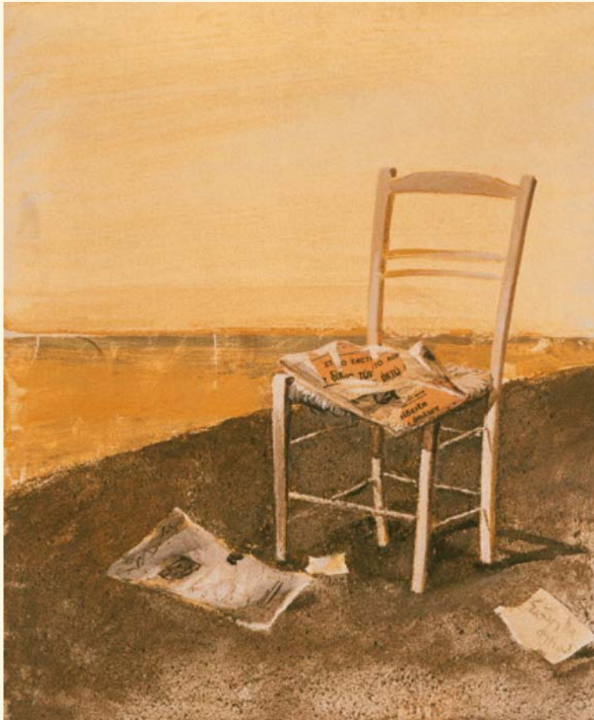
Σπύρος Βασιλείου, «Καρέκλα», μικτή τεχνική, 54,5 × 46 εκ.