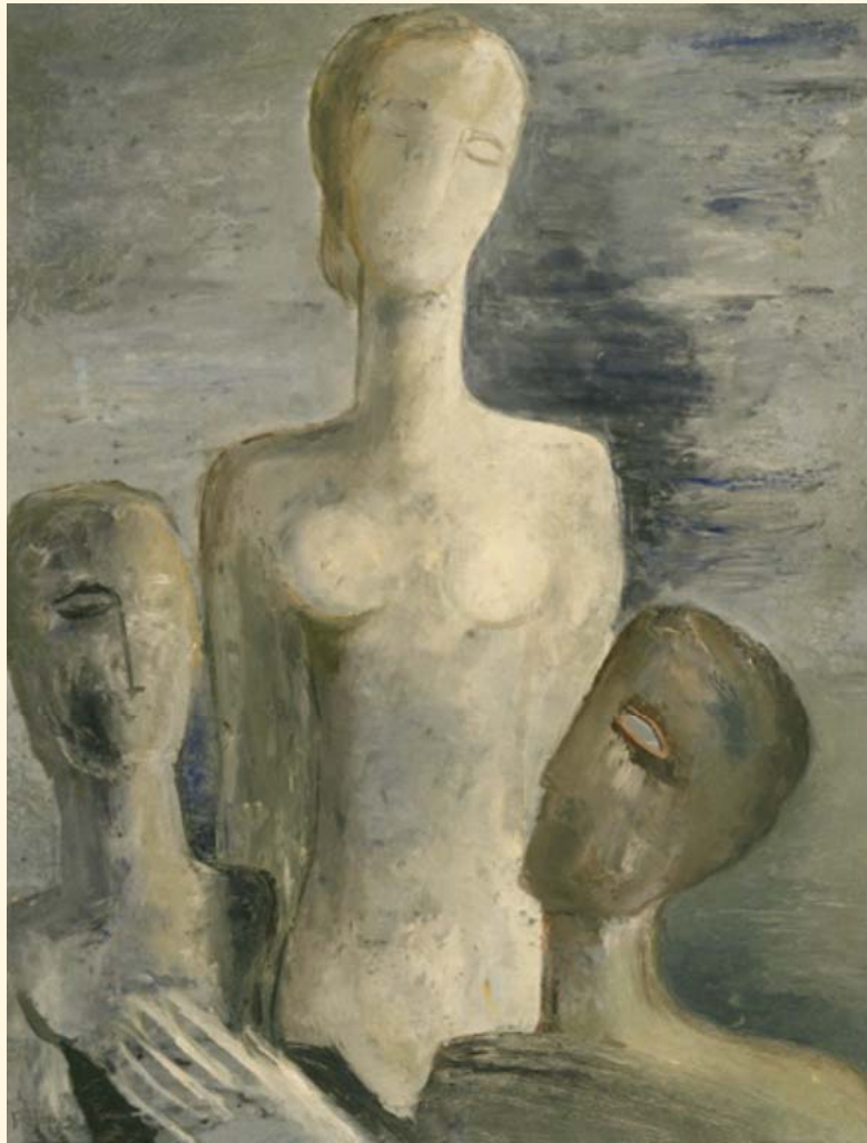
Γεράσιμος Στέρης, «Τρεις φιγούρες», 1946, λάδι, 65,5 x 50,5 εκ.