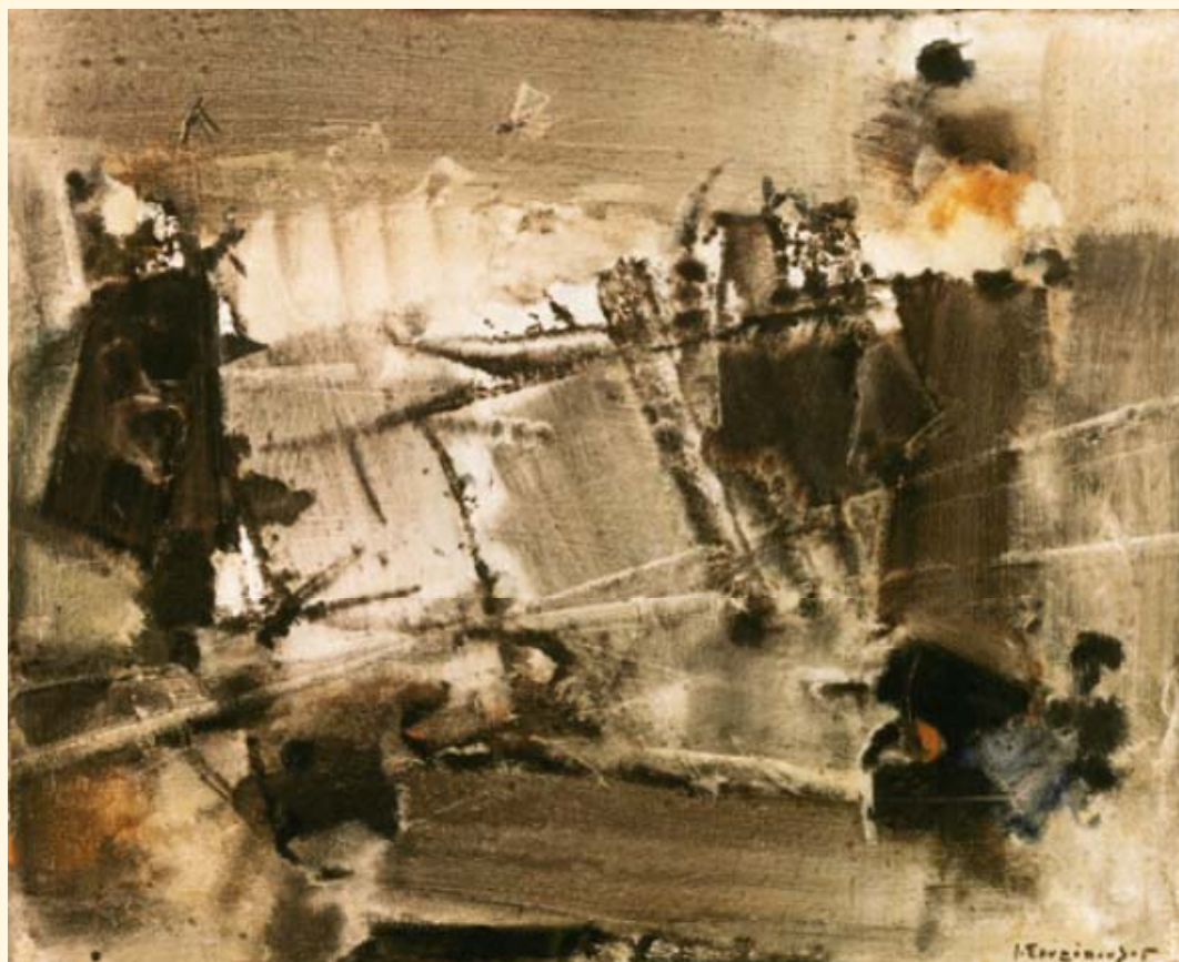
Γιάννης Σπυρόπουλος, «Σύνθεση», 1960, λάδι, 45 × 55 εκ.