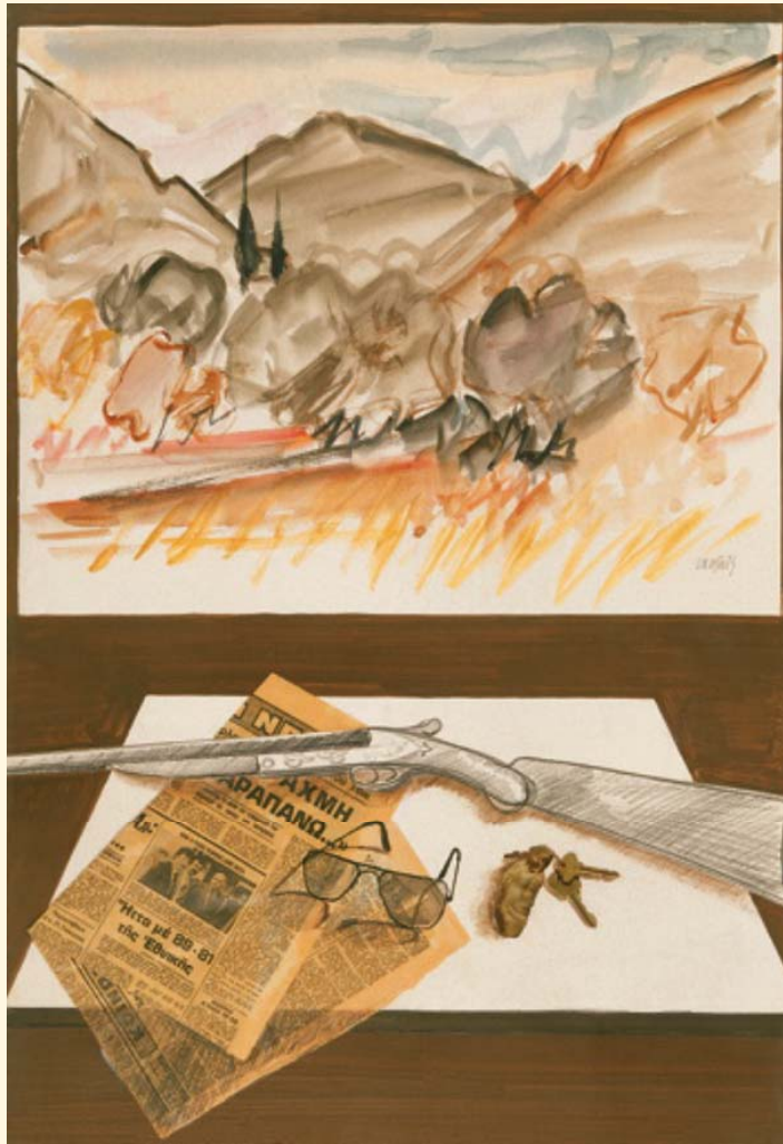
Γιώργος Λολοσιδής, «Σύνθεση», μικτή τεχνική, 99 × 67 εκ.