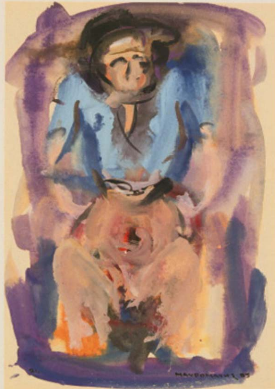
Στέλιος Μαυρομάτης, «Έρωτικό», 1985, τέμπερα, 50 × 35 εκ.