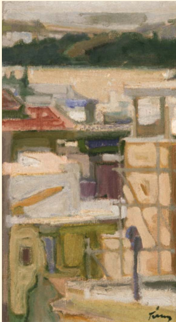
Παναγιώτης Τέτσης, «Τοπία», λάδι, 63 x 35 εκ.