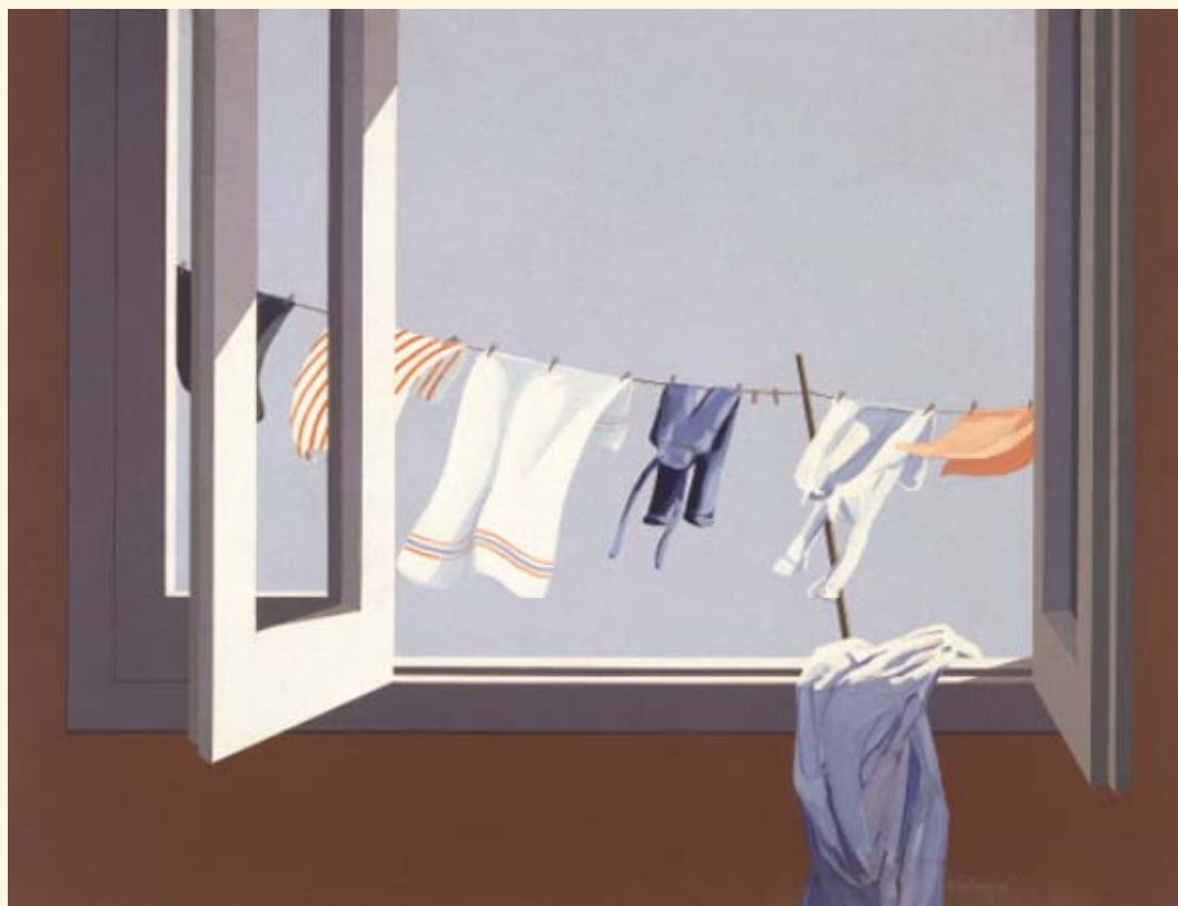
Ἄνδρέας Λαδόματος, «Μπουγάδα», 1974, λάδι, 73 x 96 ἐκ.