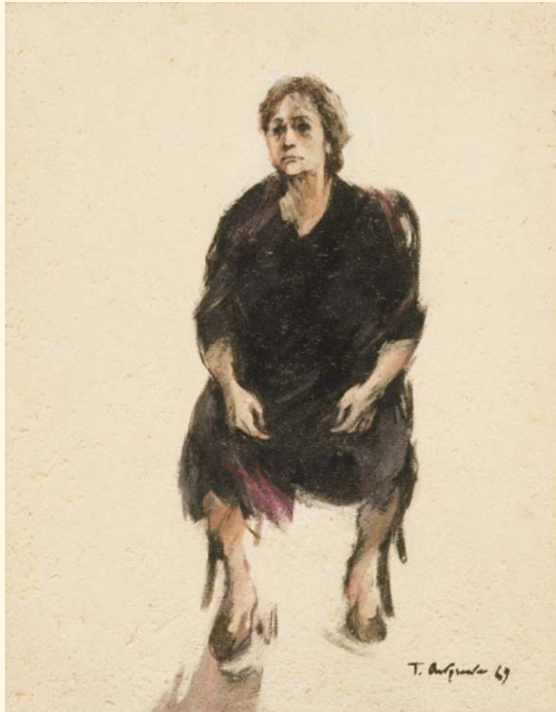
Τζούλια Ανδρεάδου, «Καθισμένη γυναίκα», 1969, λάδι, 93 x 73 εκ.