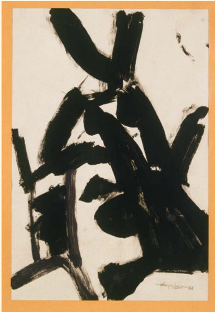
Παντελής Ξαγοράρης, Χωρίς τίτλο, 1962, πλαστικό, 45 × 31,5 εκ.