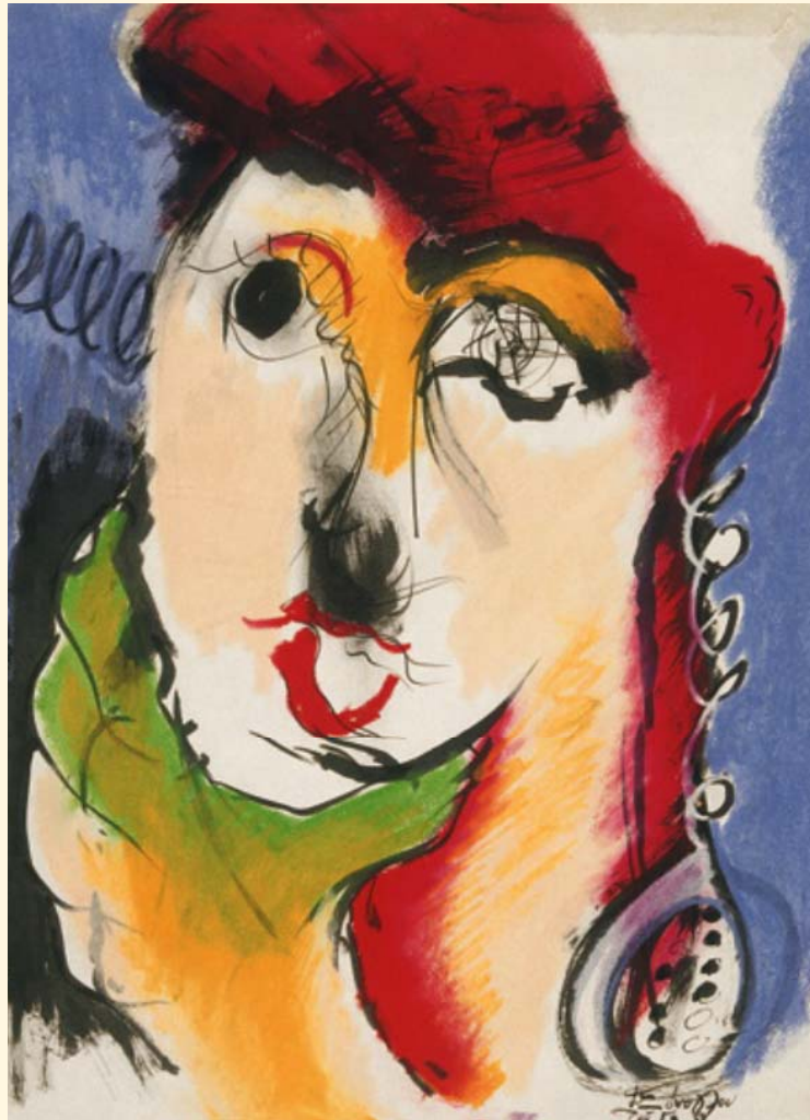
Δημήτρης Ξόνου, «Γυναικεία μορφή», 1981, παστέλ-άκουαρέλα, 50 × 37 εκ.