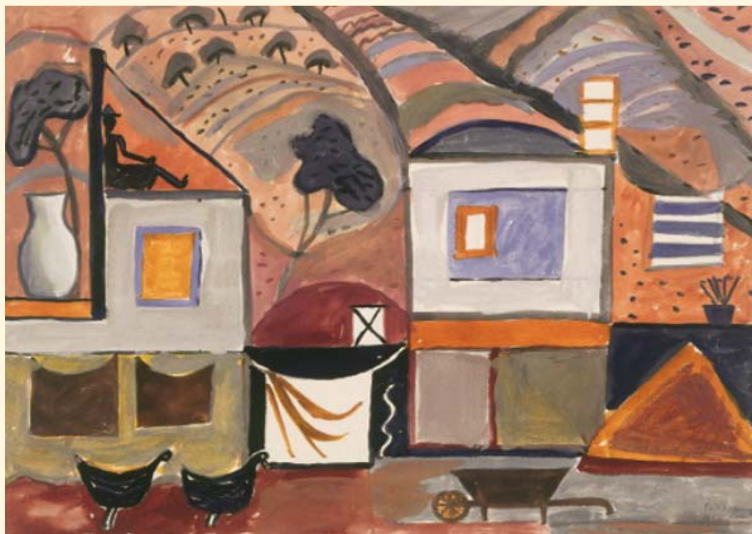
Ράλλης Κοψίδης, Χωρίς τίτλο, 1962, τέμπερα, 24,5 × 53,4 εκ.