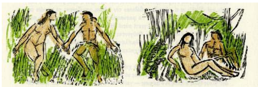
Μεικτή τεχνική ξύλογραφίας-λιθογραφίας από το Βιβλίο Γ' που απεικονίζει τον Δάφνη και τη Χλόη.

Άλλη μία μέθοδος χαρακτικής είναι η λιθογραφία , την οποία επίσης εξάσκησε ο Βαρλάμος. Ανακαλύφθηκε τυχαία από τον Alois Senefelder (1771-1834), ο οποίος ήθελε να βρει έναν τρόπο να τυπώνει ευκολότερα και με λιγότερο κόστος τα έργα του.