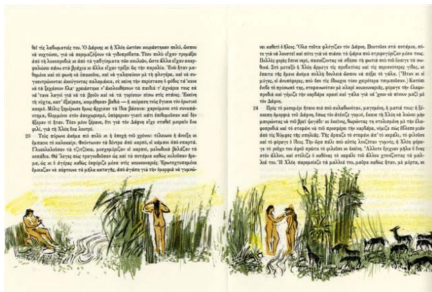
Μεικτή τεχνική ξυλογραφίας-λιθογραφίας, απεικόνιση του Δάφνης και της Χλόης.