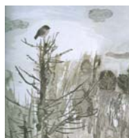
Δέντρο με πουλί