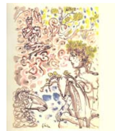
Δάφνης και Χλόη Νίκος Χατζηκυριάκος-Γκίκας, Αθήνα 1970

Σε αυτό το σημείο και έχοντας γνωρίσει τη δουλειά του Γιώργη Βαρλάμου, ας προσπαθήσουμε να καταλάβουμε την τέχνη και τις τεχνικές της χαρακτηριστικής.