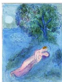
Daphnis et Chloë Marc Chagall, Παρίσι 1961