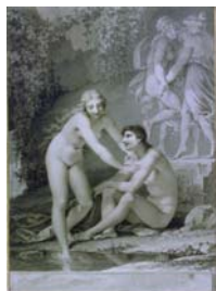
Daphnis et Chloë Pierre Prud'hon, Παρίσι 1802

Aristide Maillol και ο Marc Chagall. Μάλιστα με κάποια από τα έργα του τελευταίου διακοσμήθηκε ο θόλος της Όπερας Garnier του Παρισιού. Από τους Έλληνες καλλιτέχνες, ο Νίκος Χατζηκυριάκος-Γκίκας έδωσε τη δική του εκδοχή.