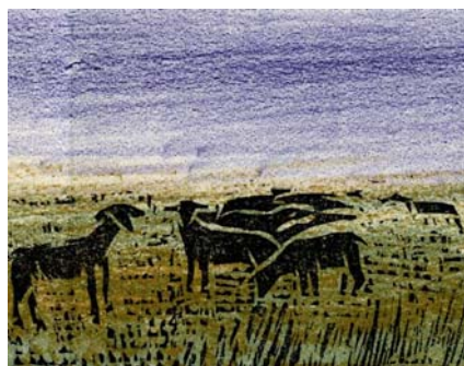
Μεικτή τεχνική ξυλογραφίας-λιθογραφίας από το Βιβλίο Δ΄ που απεικονίζει τα εγκαταλελειμμένα κατσικάκια.

Ακόμα, σύμφωνα με τα λεγόμενά του, θέλησε να εκφράσει την αντίθεσή του για την απόφαση αυτών των παιδιών να εγκαταλείψουν την αθώα ζωή μέσα στη φύση για μια συμβατική ζωή πλούσια σε υλικά αγαθά, και να τονίσει την εγκατάλειψη που ένιωσαν οι μέχρι τότε φίλοι τους, τα κατσικάκια, όταν έφυγαν από κοντά τους τα παιδιά, με τα οποία ήταν αχώριστα.