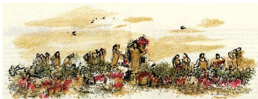
Μεικτή τεχνική ξυλογραφίας-λιθογραφίας από το Βιβλίο Β' που απεικονίζει τη γιορτή του Διονύσου.

«Αγαπώ την Ελλάδα, τον Έλληνα που κουβαλά μέσα του το ίδιο γονίδιο από την αρχαιότητα μέχρι σήμερα... την ανοιχτή του καρδιά και τη μεγαλοψυχία του στις δύσκολες στιγμές».