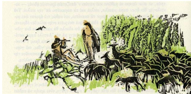
Μεικτή τεχνική ξυλογραφίας-λιθογραφίας από το Βιβλίο Δ΄ που απεικονίζει τον Δάφνη να παίζει στη φλογέρα το τραγούδι της βοσκής για την Κλεαρίστη και το Διονυσοφάνη, μη γνωρίζοντας ότι είναι οι πραγματικοί του γονείς.

Τα έργα που παρουσιάζονται στο πρόγραμμα αυτό αφορούν τις ξυλογραφίες και λιθογραφίες που φιλοτέχνησε για το μυθιστόρημα Δάφνης και Χλόη του Λόγγου, εκδ. Διάπτων, σε μετάφραση Ρόδη Ρούφου. Ο ίδιος θεωρεί ότι με την τέχνη του μπόρεσε να μετατρέψει το κείμενο αυτό σε χρώμα και εικόνα και να δράσει σαν ένας κρίκος για τη μεταφορά του συναισθήματος ανάμεσα στο συγγραφέα και στον αναγνώστη.