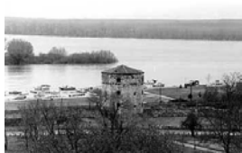
viii Ο πύργος Nebojsa

Οι πληροφορίες για τη μυστική επαναστατική δράση του Ρήγα είναι ασαφείς και προέρχονται κυρίως από μαρτυρίες βιογράφων και πληροφορίες τις οποίες απέσπασε η ανάκριση των Αυστριακών αρχών μετά τη σύλληψη του Ρήγα και των συντρόφων του. Το πιθανότερο είναι πως δεν είχε ακόμα δημιουργηθεί οργανωμένη επαναστατική ομάδα αλλά διάσπαρτες επαφές με ομοεθνείς που πίστευαν στις ιδέες του Ρήγα.