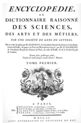
iv. Εξώφυλλο της περιφημής Εγκυκλοπαίδειας

Ήταν βαθιά επηρεασμένος από τον γαλλικό διαφωτισμό 2 και τις θέσεις των Εγκυκλοπαιδιστών και είχε σαν κύριο στόχο του, όπως και ο Ρήγας αργότερα, την «κοινή προκοπή».