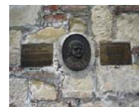
ix Αναμνηστική πλάκα στον πύργο

Ο Ρήγας συνελήφθη στην Τεργέστη την 1η Δεκεμβρίου του 1797. Κατόπιν οδηγήθηκε στη Βιέννη, όπου ανακρίθηκε μαζί με τους υπόλοιπους συντρόφους του. 4 Μετά από συνεννοήσεις που έγιναν με το Σουλτάνο, οι αυστριακές αρχές παρέδωσαν τους οθωμανούς υπηκόους στην Οθωμανική επικράτεια για να υποστούν τις κυρώσεις του Σουλτάνου. Ο Ρήγας και οι επτά σύντροφοί του, με συνοδεία των αυστριακών αρχών, παραδόθηκαν στους Τούρκους του Βελιγραδίου και φυλακίστηκαν στον πύργο Nebojsa, του Βελιγραδίου όπου δολοφονήθηκαν στις 24 Ιουνίου 1798.