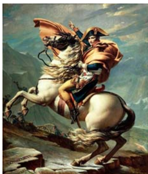
vii. Général Bonaparte (1801), Jacques-Louis David.

Παράλληλα με τις εκδοτικές του δραστηριότητες, ο Ρήγας προετοίμαζε και την αναχώρησή του από την Αυστρία, κυρίως εξαιτίας του επαναστατικού κλίματος που είχε καλλιεργήσει η Γαλλική Επανάσταση και της διάθεσής του να συνεργαστεί με τον Βοναπάρτη , που ξεκίνησε ως θερμός δημοκράτης προτού γίνει αυτοκράτορας, τον οποίο θαύμαζε για τις ιδέες του και πίστευε στη βοήθειά του.