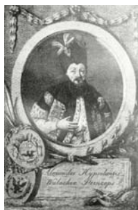
ii. Αλέξανδρος Υψηλάντης . Μέγας διεργμηνέας της Υψηλής Πύλης και ηγεμόνας της Μολδοβλαχίας

Ο Ρήγας γεννήθηκε στο Βελεστίνο της Θεσσαλίας, τις αρχαίες Φερές, το 1757, από εύπορη οικογένεια. Το 1785 πήγε στην Κωνσταντινούπολη, όπου εντάχθηκε στο περιβάλλον των Φαναριωτών . 1 Εκεί γνωρίστηκε με τον πρίγκιπα Αλέξανδρο Υψηλάντη και το 1786 τον ακολούθησε στη Μολδοβλαχία.