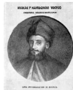
v. Νικόλαος Μαυρογένης

Το 1788 γνώρισε και ακολούθησε τον ηγεμόνα της Μολδοβλαχίας Νικόλαο Μαυρογένη στο Βουκουρέστι, όπου άρχισε να εργάζεται για την υλοποίηση του σχεδίου της ίδρυσης Βαλκανικής Ομοσπονδίας και της απελευθέρωσης του Γένους. Ο Ρήγας επεδίωκε μέσα από το μεταφραστικό και το πρωτότυπο συγγραφικό του έργο να φέρει σε επαφή τους Έλληνες με τη δυτική σκέψη και να τους προετοιμάσει για τη διεκδίκηση της ελευθερίας τους. Εμπνευσμένος από τον άνεμο της ελευθερίας που έπνεε στην Γαλλία και τη δυτική Ευρώπη στα τέλη του 18ου αιώνα, ο Ρήγας τύπωσε εκτός από διάφορα άλλα κείμενα διδακτικά και επαναστατικά, τη Μεγάλη Χάρτα της Ελλάδος , 3 ένα μνημειώδη για την εποχή του χάρτη, διαστάσεων 2,07 x 2,07 μ., σε δώδεκα φύλλα. Η φύση του χάρτη, του επέτρεψε μέσω μιας εικόνας να μεταδώσει με συνοπτικό τρόπο πολλές ιδέες και να δείξει παραστατικά την έκταση και την ακτινοβολία του Ελληνισμού. Θα μπορούσε να θεωρηθεί συμπλήρωμα του κειμένου του Θούριου . Ο Ρήγας έκανε εντατική χρήση της εικόνας και του τραγουδιού για να ενισχύσει το όραμά του για ελευθερία και για να το κάνει κατανοητό σε όλους τους σιλαβωμένους λαούς.