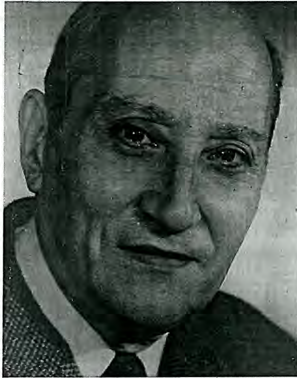
«Οι νεαρές των μακεδονικών δυναστειών» είναι ένα σημαντικό έργο του Ν. Σβορώνου που θα κυκλοφορήσει στα ελληνικά, σε επιμέλεια και μετάφραση του Π. Γουναρίδη. Αριστερά, ο ακούρατος μελετητής, δεξιά το εξώφυλλο της έκδοσης.

Ανάμεσα στα κατάλοιπα του Ν. Σβορώνου συγκαταλέγεται το έργο του για τις «νεαρές» των αυτοκρατόρων της Μακεδονικής δυναστείας, που αφορούν τη γη και τους στρατιώτες. Το έργο αυτό, από τις μεγάλες συνεισφορές του εκλιπόντος στη βυζαντινολογική επιστήμη, ήταν έτοιμο προς έκδοση πριν από το θάνατό του. Με τη διαθήκη του, ο Ν. Σβορώνος μου ανέθετε να φροντίσω για την έκδοσή του. Σε παλαιότερη συζήτηση είχε εκφράσει την επιθυμία του να δει το έργο αυτό να εκδίδεται από το Κέντρο Βυζαντινών Ερευνών του Εθνικού Ιδρύματος Ερευνών, αλλά ταυτόχρονα «απειλούσε» ότι θα το δίνε να εκδοθεί από το Μορφωτικό Ίδρυμα Εθνικής Τραπέζης. Έτσι, θεώρησα απαραίτητο να απευθυνθώ, εκτός από το Κέντρο Βυζαντινών Ερευνών και προς το Μορφωτικό Ίδρυμα Εθνικής Τραπέζης, προκειμένου το έργο να συνκευθωθεί από τους παραπάνω φορείς. Εξάλλου, εφελκίζοντας το δακτυλόγραφο, διαπίστωσα ότι στην προετοιμασία του κειμένου ήταν εμπλεγμένοι και ο παλιός συνάδελφος και φίλος του Ν. Σβορώνου, καθηγητής André Guillou. Απευθύνθηκα λοιπόν και προς αυτόν για να συμμετάσχει και η Γαλλία στην έκδοση, δεδομένου άλλωστε ότι το έργο είχε εκπονηθεί εκεί. Ομως, παρά την προθυμία του καθηγητή André Guillou, η γαλλική συμμετοχή δεν ευσώθηκε.