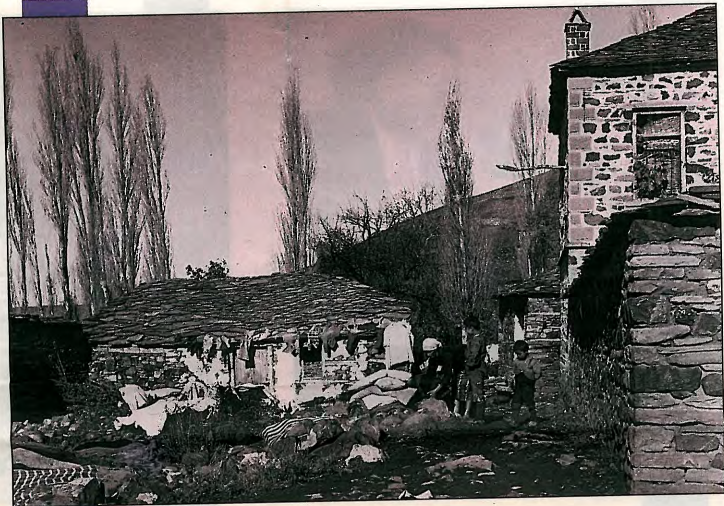
Μπόρια, Νοέμβριος 1937

Σ υστηματικός ταξιδευτής και συνειδητός περιηγητής, σε εποχές που ο τουρισμός και τα ταξίδια δεν είχαν προσλάβει το σημερινό μαζικό χαρακτήρα, ο ποιητής Γιώργος Σεφέρης κουβαλάει πάντα στις μετακινήσεις του δύο απαραίτητους συντρόφους: τον ταξιδιωτικό οδηγό της περιοχής που επισκέπτεται, και τη φωτογραφική μηχανή του. (Στη βιβλιοθήκη του εντυπωσιάζει ο μεγάλος αριθμός ταξιδιωτικών βιβλίων-οδηγών, πάντα με σημειώσεις, ερωτηματικά, θαυμαστικά και υπογραμμίσεις του ποιητή).