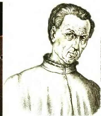
Ο Πότζο Μπρατσολίνι σε σχέδιο από βιβλίο του 1825