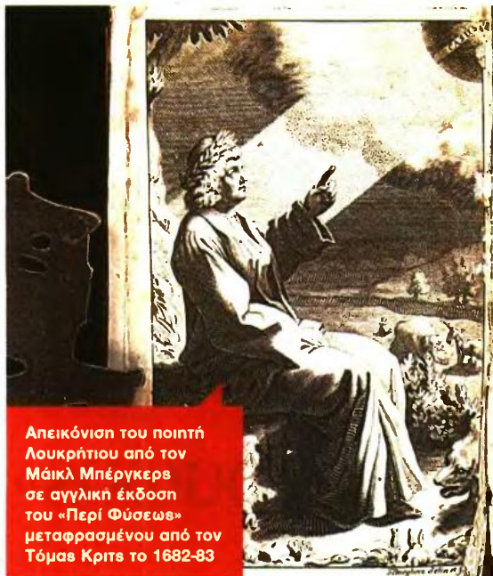
Απεικόνιση του ποιητή Λουκρήτιου από τον Μάικλ Μπέρκερ σε αγγλική έκδοση του «Περί Φύσεως» μεταφρασμένου από τον Τόμας Κριτς το 1682-83