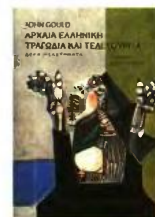
John Gould ΑΡΧΑΙΑ ΕΛΛΗΝΙΚΗ ΤΡΑΓΩΔΙΑ ΚΑΙ ΤΕΛΕΤΟΥΡΓΙΑ ΔΕΚΑ ΜΕΛΕΤΗΜΑΤΑ

Ο ευρωπαίος άνθρωπος δεν μπορεί να αντιληφθεί πως μία παιδοκτόνος, ένας μοικός, ένας πατροκτόνος, μία συζυγοκτόνος εκτίθεται, απολογείται, κρίνεται και δικάζεται από τον λαό - Χορό, δημόσια. Εμαθαν ποτέ οι γείτονες της Εντα Γκάμπλερ, της Μπερνάντα Αλμπτα, της Στέλλας Βιολάντη ή του Κόστια του «Γλάρου» από τι και πώς και γιατί πέθαναν οι ήρωες εντός των κεκλεισμένων θυρών;