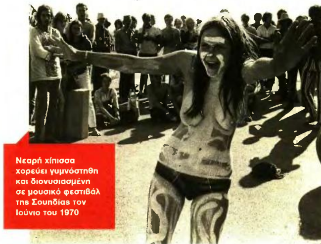
Νεαρή χήπισσα χορεύει γυμνάστηθη και διονυσιασμένη σε μουσικό φεστιβάλ της Σουηδίας τον Ιούνιο του 1970

Πίσω από πολλά τέτοια μελετήματα διαπιστώνει ο αναγνώστης και όχι μόνο ο ειδικός μελετητής αυτό που είναι σύμφυτο με όλη την εξέλιξη των ανθρωπίνων κοινωνιών. Την τελετουργία. Εδώ σπεύδω να σημειώσω πως η τελετουργία (σύνθετη λέξη από το τέλος και έργο) διπλώνει μια διαδικασία, ένα έργο, μια δράση που έχει ορισμένο τέλος, δηλαδή σκοπό. Σίγουρα σήμερα στη γλώσσα μας έχει αλλοιωθεί η πραγματική σημασία της λέξης: τέλος. Δεν είναι βέβαια το πέρας μιας πράξης, μιας ενέργειας, αλλά η καταληξη μιας διαδικασίας που επιδιώκει να κατακτήσει έναν ορισμένο