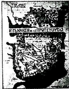
Ζιλιμπέρ Νταγκρόν: «Η Κωνσταντινούπολη και οι θεσμοί της 330-451».