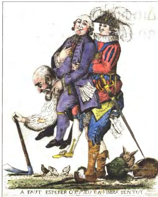
«Άς ελπίσουμε ότι αυτό το παιχνίδι θα τελειώσει γρήγορα». Καρικατούρα του 18ου αιώνα που αναπαριστά την τάξη των αγροτών στη Γαλλία, θέμα εκμετάλλευσης των γαιοκτημόνων και του κλήρου.

Η Εκκλησία δεν φοβάται τα επιμέρους πορίσματα της φυσικής επι-