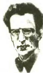
Ο ποιητής Τέλλος Αγρας

Η ντελικάτη ποίηση του καλλιπούς Τέλλου Αγρα, που χάθηκε χωρίς, από μια αδέσποτη σφαίρα στο πόδι την ημέρα της Απελευθέρωσης της Αθήνας από τους Γερμανούς, συμπορεύεται με την κοινωνική ευαισθησία των καιρών μας.