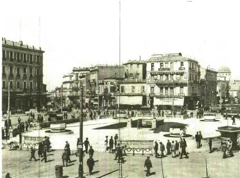
Η πλατεία Ομονοίας τη δεκαετία του 1930