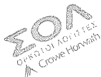
ΝΙΚΟΛΑΟΣ Σ. ΝΑΚΟΣ

Ορκωτός Ελεγκτής Λογιστής Α.Μ. ΣΟΕΛ14071