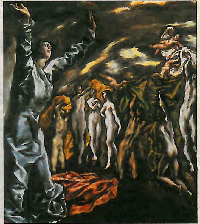
Ελ Γκρέκο, "Το άνοιγμα της Πέμπτης Σφραγίδας της Αποκάλυψης", περ. 1608-1614. Σχολιάζει ο Γκόμπριχ:

Το μικρό βιβλίο του Γκόμπριχ Σκιαί ερριμμένοι κυκλοφόρησε το 1995, με αφορμή σχετική έκθεση που οργάνωσε ο ίδιος στην Αίθουσα Στάνλεϊ της Εθνικής Πινακοθήκης του Λονδίνου. Φαινόμοιο φυσικής ζωτικότητας και πνευματικής φρεσκότητας, ο Γκόμπριχ εντυπωσιάσε με την ευρηματικότητα της προσέγγισής του στο θέμα της σκιάς – θέμα κυρίαρχο στο φυσικό και άλλο περιβάλλον μας αλλά μάλλον ελλιπώς απεικονισμένο. Στο βιβλίο αυτό εξετάζει τον διφορούμενο ρόλο των σκιών στους μύθους, τους θρύλους και τη φιλοσοφία. Επίσης, αναλύει εν συντομία τους παράγοντες που διαμορφώνουν το σχήμα των σκιών: το σημείο και τη φύ-