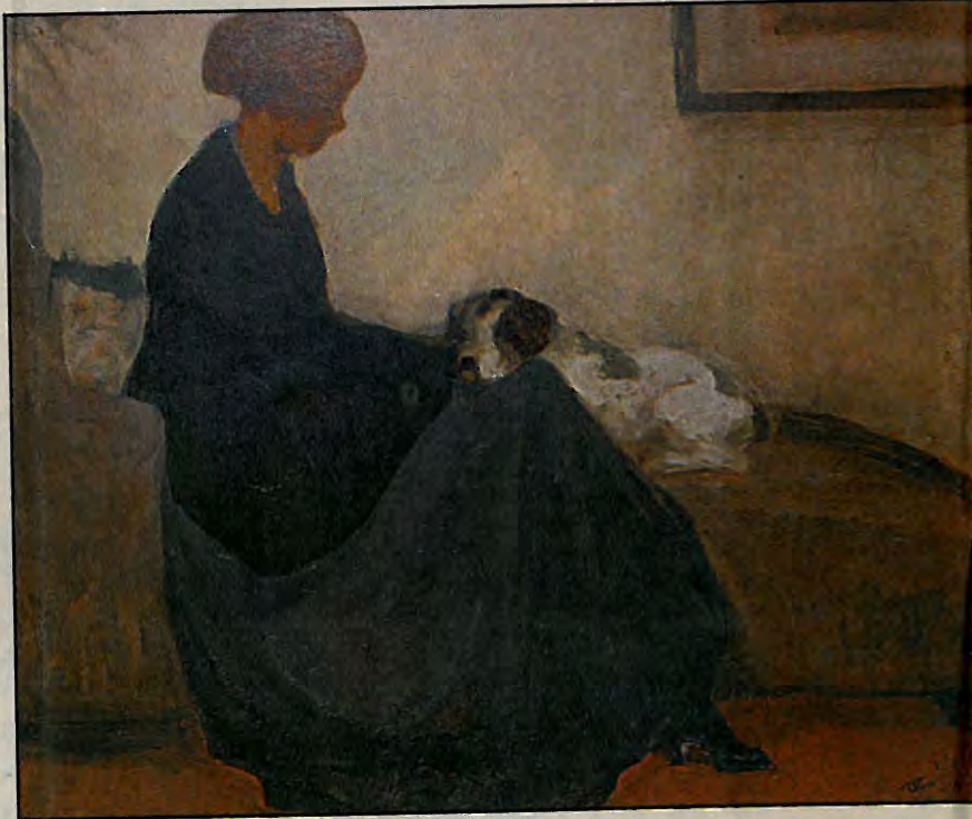
«Η Κυρία με το Σκύλο», έργο του 1915 του Π. Βυζάντιου.

Ο Βυζάντιος δεν κρατούσε συστηματικά αρχείο, «δεν έδειχνε καμία αξία στην επιφανειακή επιμελημένη συσσώρευση νέων ανεπεξέργαστων ιδεών, προτιμούσε