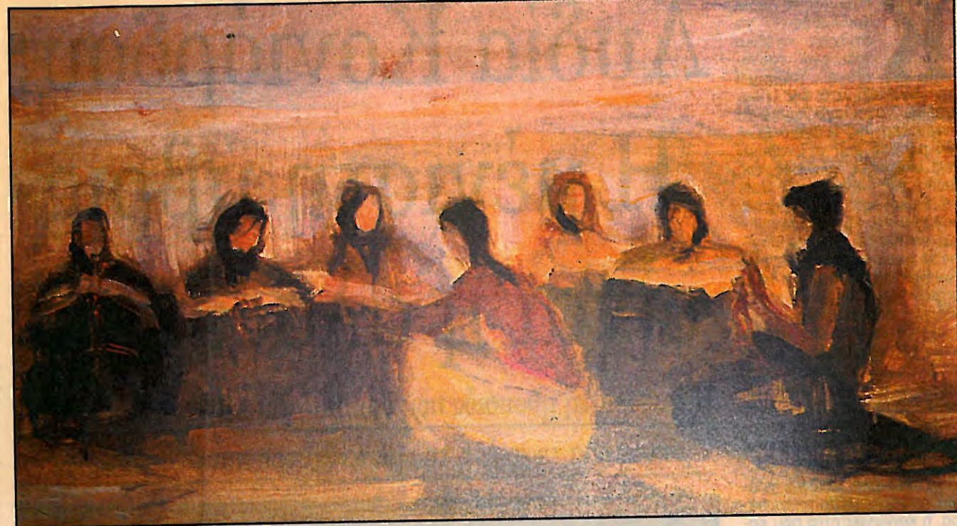
Περικλή Βυζάντιου: «Γυναίκες των Δελφών». Ελαιογραφία του 1940.

Οι πρώτες ζωγραφίες. «Δεν αποφάσισα να γίνω ζωγράφος: ζωγράφος ήμουν από μικρός. Ζωγράφιζα και σχεδιάζα ό,τι έβλεπα γύρω μου: τον καστανά, τον στραγαλατζή, τους σκύλους, τη γάτα του σπιτιού, το άλογο του πατέρα μου που του το έφερναν το πρωί που ξεκίναγε με τον υπασπιστή του να πάει στο Σύνταγμα του Πυροβολικού που διοικούσε. Ολα αυτά, βέβαια, άρεσαν στους δικούς μου, αλλά με τη συμφωνία ότι θα έδινα αργότερα εξετάσεις στη Σχολή των Ευελπίδων ή των Δοκίμων, μια κι αυτό απαιτούσε η παράδοση της οικογένειας. Εγώ όμως δεν είχα καμία διάθεση να φορέσω στολή και να κρεμάσω ένα σπαθί στη μέση. Είχα