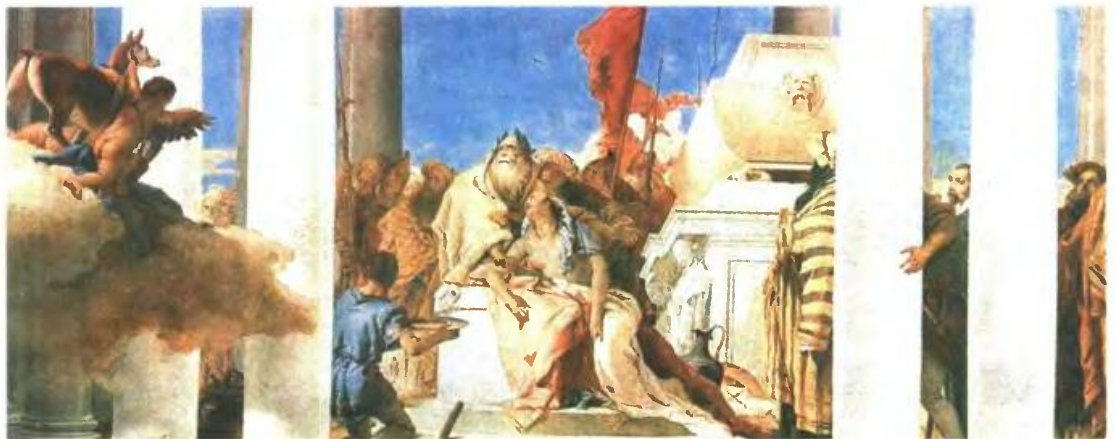
«Η θυσία της Ιφιγένειας», λεπτομέρεια από τοιογραφία του Τζιοβάνι Μπατίστα Τιέπολο (1757)

Από τους εγκυρότερους μελετητές της αρχαίας ελληνικής θρησκείας και ομότιμος καθηγητής των Πανεπιστημίων της Ζυρίχης και του Βερολίνου, ο Μπούρκερτ ξεκινά από μια ευρύτερη ανθρωπολογική θεώρηση και επιχειρεί τη διατύπωση μιας γενικής θεωρίας της γένεσης της θρησκείας και του πολιτισμού (κεφάλαιο 1ο), επιχειρηματολογώντας ως εξής: όντας αναγκασμένοι να σκοτώσει για να τραφεί, ο άνθρωπος - κυνηγός από τη μία ένιωθε αποτροπισμό και ενοχή για την πράξη του, από την άλλη όμως ήταν χαρούμενος επειδή κατάφερνε να επι-