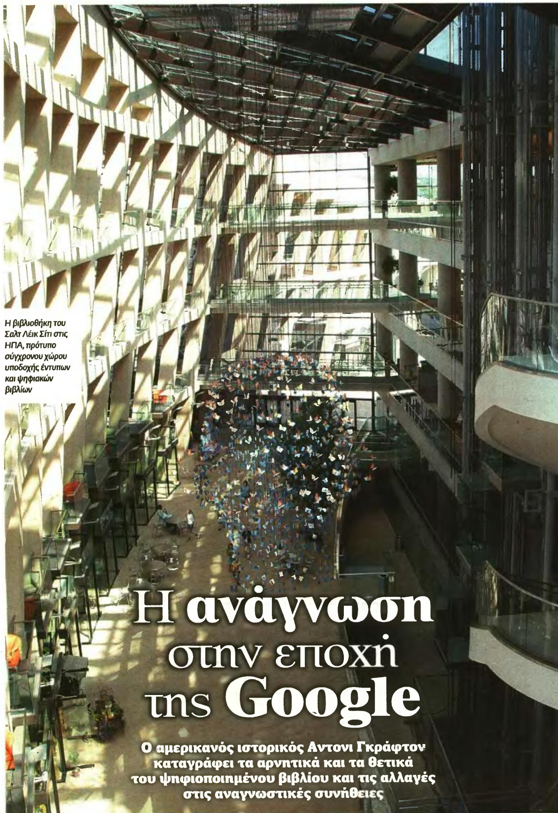
Η βιβλιοθήκη του Σαλτ Λέικ Σίτι στις ΗΠΑ, πρότυπο σύγχρονου χώρου υποδοχής έντυπων και ψηφιακών βιβλίων