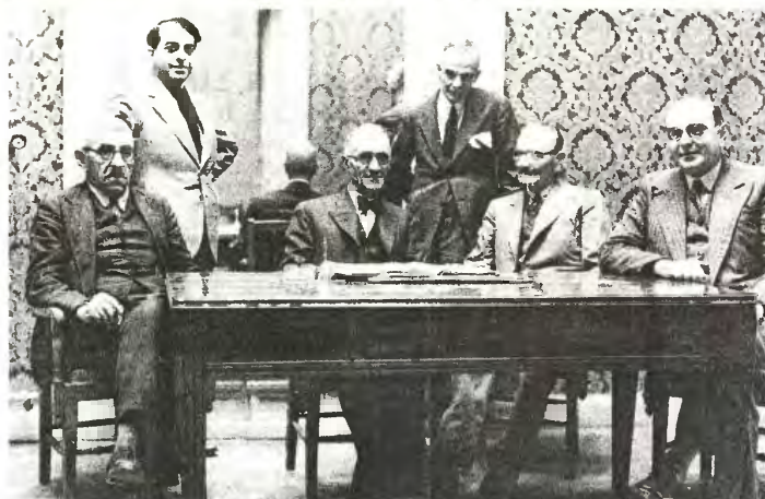
Η καλλιτεχνική επιτροπή του Εθνικού Θεάτρου το 1933: Παύλος Νιρβάνας, Φώτος Πολίτης, Ιωάννης Γρυπάρης, Γεώργιος Βλάχος, Γρηγόριος Ξενόπουλος και Θεόδωρος Ν. Συναδινός