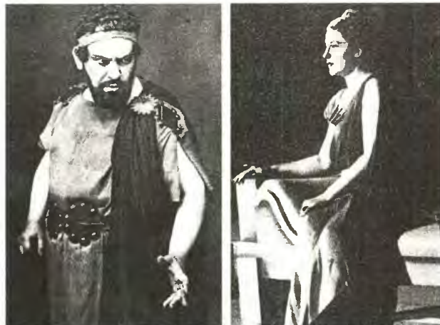
Ο Αιμίλιος Βεάκης ως Οιδίπους στην παράσταση «Οιδίπους τύραννος» το 1933 και η Κατίνα Παξινού ως Φαίδρα στον «Ιππόλυτο» του 1937