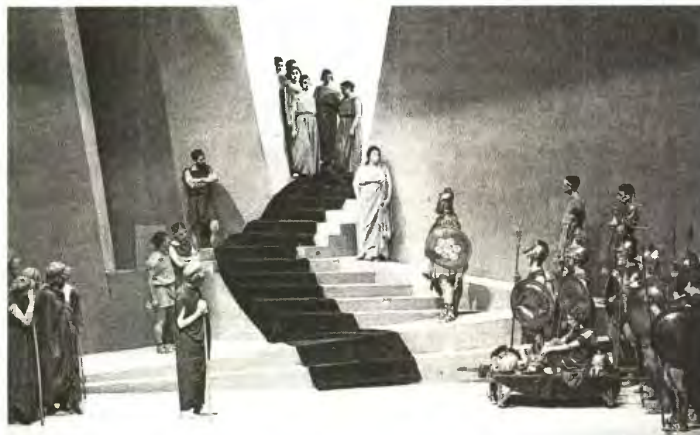
Με τον «Αγαμέμνονα» του Αισχύλου σκώθηκε η αυλαία του Εθνικού Θεάτρου το 1932