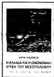
MARK MAZOWER* Η Ελλάδα και η οικονομική κρίση του Μεσοπολέμου ΜΤΦΡ.: ΣΠΥΡΟΣ ΜΑΡΚΕΤΟΣ ΓΛΩΣΣ. ΕΠΙΜ.: ΤΑΤΙΑΝΑ ΙΩΑΝΝΙΝΟΥ ΣΧΕΔΙΑΣΜΟΣ: ΑΝΤΙΓΟΝΗ ΦΙΛΙΠΠΟΠΟΥΛΟΥ *ΕΚΔΟΣΕΙΣ 2002*, ΣΕΛ. 433, € 22

Αύγουστο του 1936, όταν ο Κλάυους Μεταξάς επέβαλε τη δικτατορία του. Βασίζόμενος σε τραπεζικές εκθέσεις, σε εκδόσεις ειδικών οργανισμών και στον εβδομαδιαίο οικονομικό τύπο της εποχής, ο συγγραφέας τονίζει ότι θέλησε να ανοίξει για την έρευνα τη μέχρι πρότινος παραμελημένη ιστοριογραφία της νεότερης Ελλάδας και να εφαρμόσει την υπόδειξη του Νίκου Σθορώνου, ο οποίος συμβούλευε κάποτε τους ιστορικούς να πάψουν πια να επικαλούνται τον περιφημο «ξένο δάκτυλο» και να μελετήσουν τις αλληλεπιδράσεις των εγχώριων πολιτικών, οικονομικών και κοινωνικών δυνάμεων.