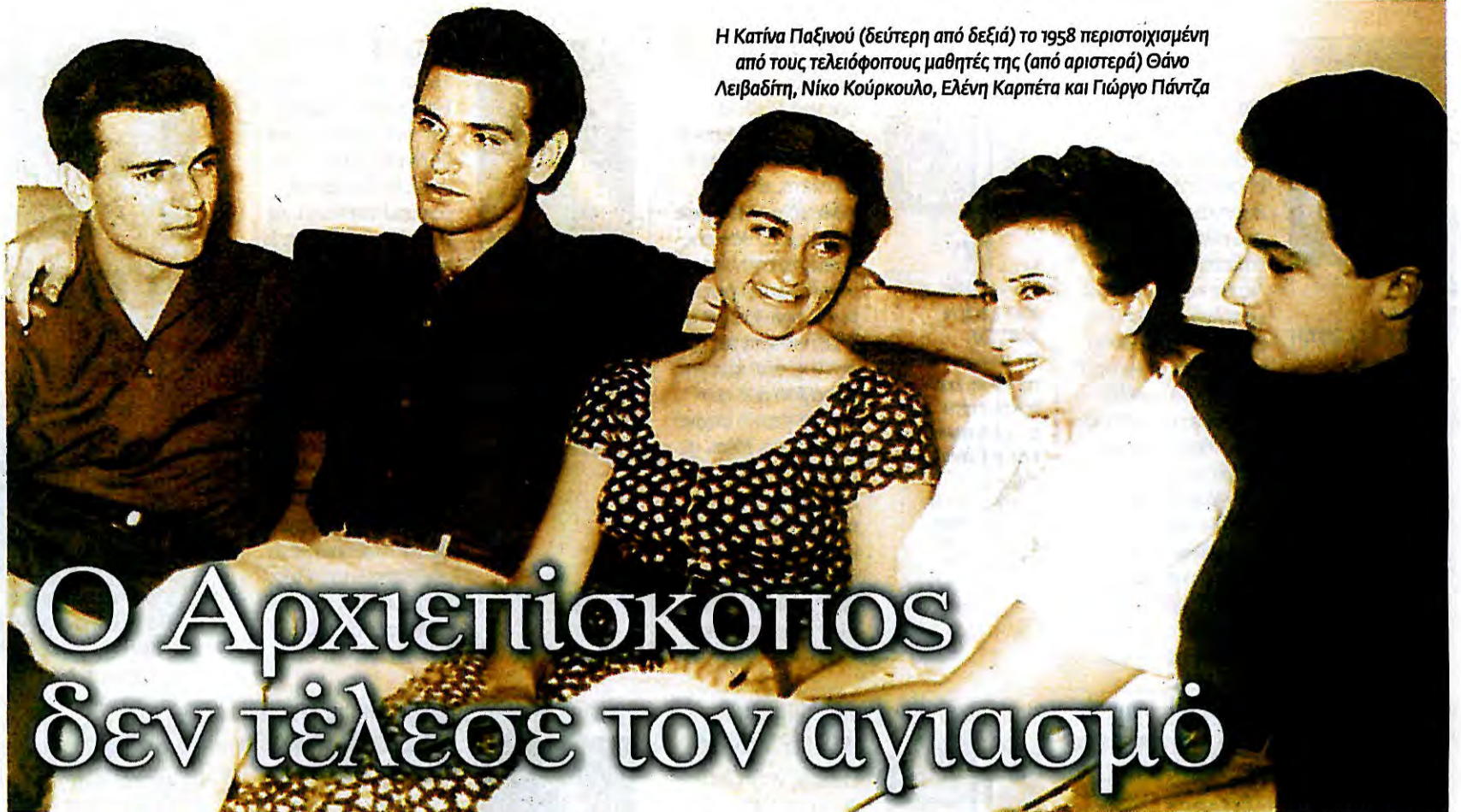
Η Κατίνα Παξινού (δεύτερη από δεξιά) το 1958 περιστοιχισμένη από τους τελειόφοιτους μαθητές της (από αριστερά) Θάνο Λειβαδίτη, Νίκο Κούρκουλο, Ελένη Καρπέτα και Γιώργο Πάντζα