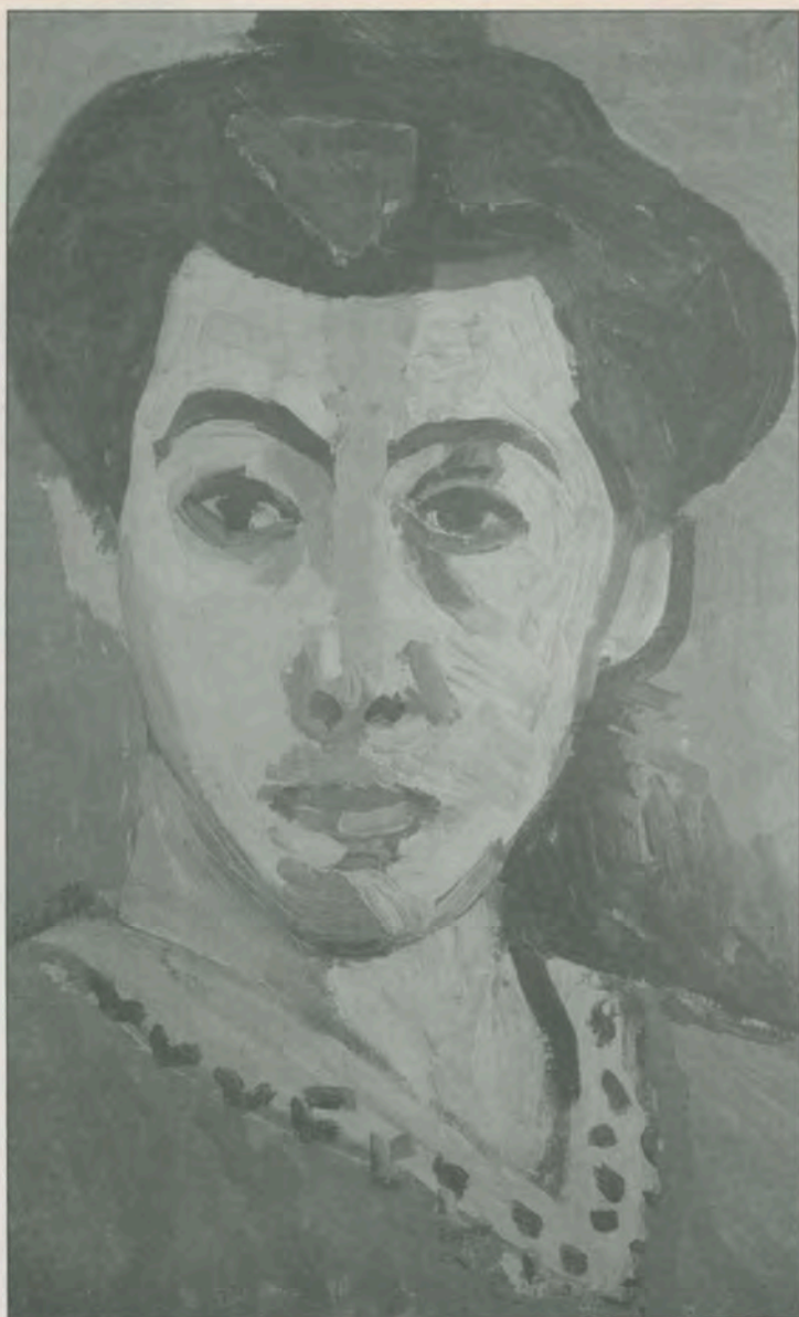
Henri Matisse: Πορτραίτο με την πράσινη γραμμή, 1905, Μουσείο Τέχνης Statens, Κοπεγχάγη