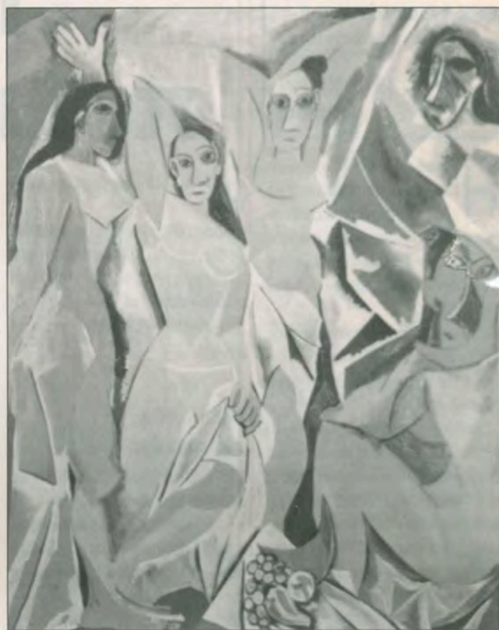
Pablo Picasso: Οι δεσποινίδες της Αβινιόν, 1907, Μουσείο Μοντέρνας Τέχνης Ν. Υόρκη

Ο ρόλος του κριτικού, του θεωρητικού, υπήρξε σημαντικός στο να διαμορφωθούν και να αποκτήσουν κύρος νέες καλλιτεχνικές δραστηριότητες (χαρακτηριστικό είναι το παράδειγμα του Αφηρημένου Εξπρεσιονισμού). Παράλληλα πρέπει να